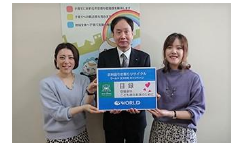
2019年11月19日(火) 宮城県保健福祉部次長 武内 浩行様(写真中央)に目録を贈呈するワールドストアパートナーズ社員

「東日本大震災みやぎ子ども育英募金」の寄附金を基金として積立て、被災した子どもたちの安定した生活と希望する進路選択の実現を支援するための奨学金・支援金として活用している。