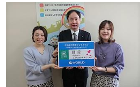
2019年11月19日(火) 宮城県保健福祉部次長 武内 浩行様(写真中央)に目録を贈呈するワールドストアパートナーズ社員

「東日本大震災みやぎ子ども育英募金」の寄附金を基金として積立て、被災した子どもたちの安定した生活と希望する進路選択の実現を支援するための奨学金・支援金として活用している。