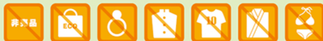
非売品 (雑誌付録・景品・ 手作り品等)