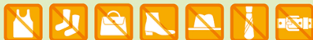
下着等 (ナイトウェア)